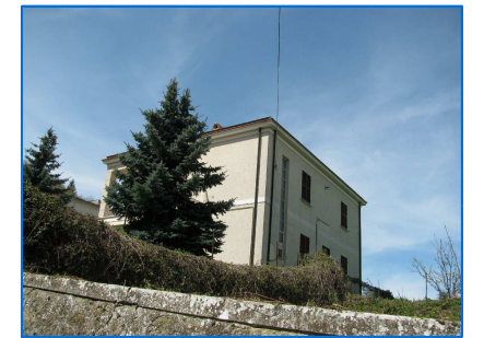
Foto 2 - Prospetto