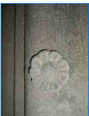
Foto 6 - Elemento di pregio

Scheda Part. n. 428 n. 62953 del 28.04.2009 A B/C D E F Part. n. 426 NO A B/C D E F Part. n. 429 NO A B/C D E F