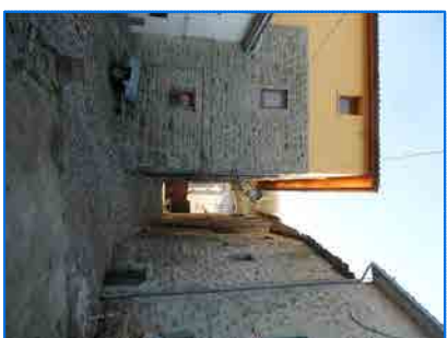
Foto 1 - Prospetto