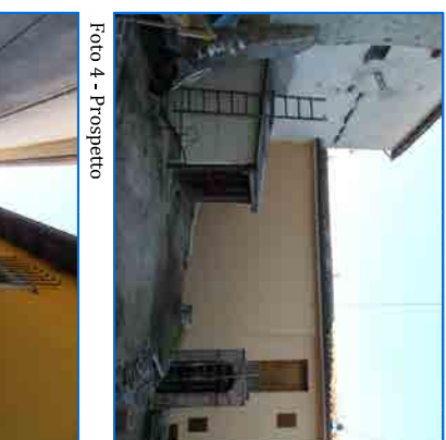
Foto 4 - Prospetto