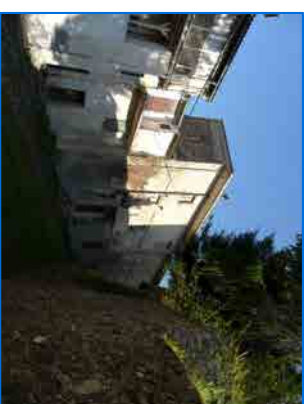
Foto 7 - Prospetto