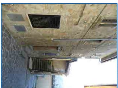
Foto 3 - Prospetto