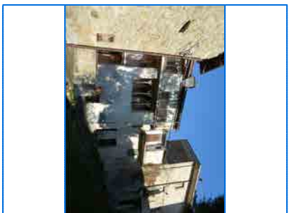
Foto 2 - Prospetto