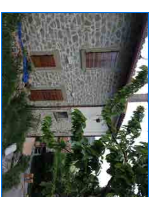
Foto 5 - Prospetto