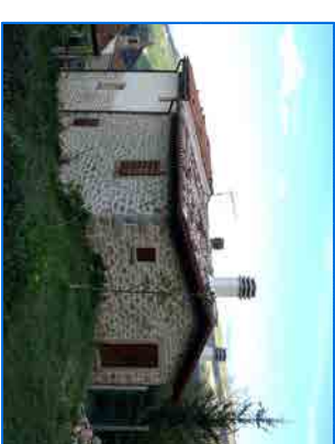
Foto 2 - Prospetto