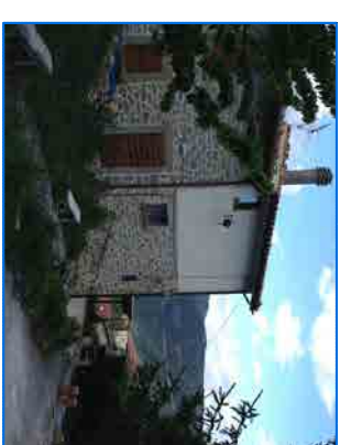
Foto 4 - Prospetto