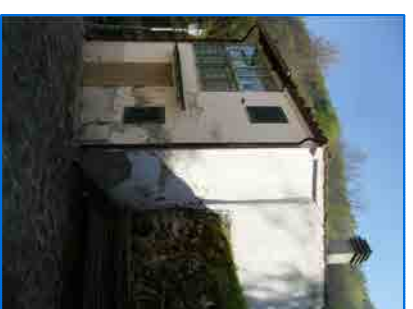
Foto 1 - Prospetto