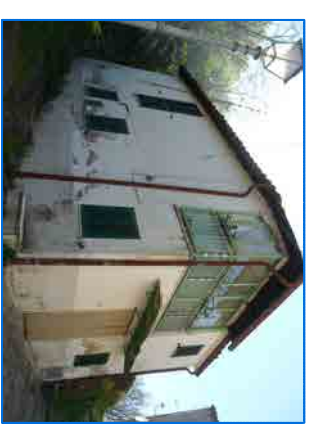
Foto 3 - Prospetto