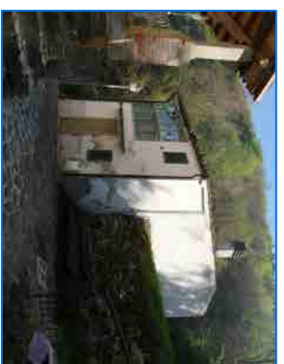
Foto 2 - Prospetto