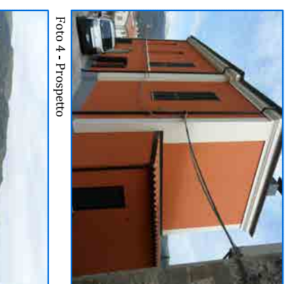
Foto 4 - Prospetto