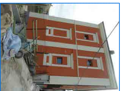
Foto 1 - Prospetto