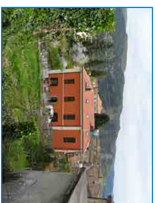
Foto 6 - Prospetto

Provvedimenti di messa in sicurezza No SI Esiti agibilità nell'aggregato Scheda A B/C D E F Part. n. 412 n. 63002 del 06.05.2009