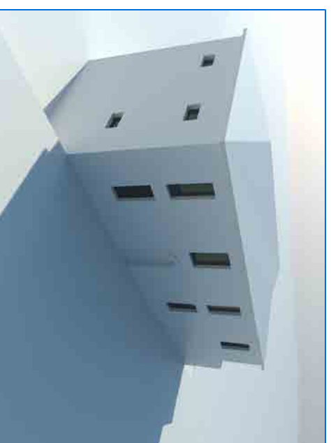
SCHEMA VOLUMETRICO Rappresentazione modello tridimensionale