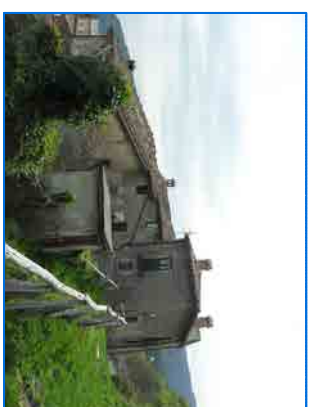
Foto 5 - Prospetto