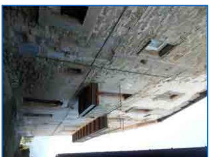
Foto 1 - Prospetto