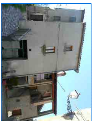
Foto 4 - Prospetto