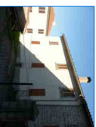
Foto 7 - Prospetto