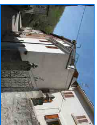
Foto 4 - Prospetto