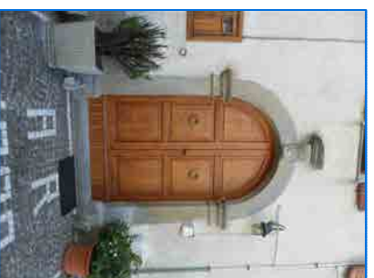
Foto 2 - Elemento di pregio