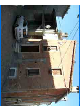
Foto 5 - Prospetto