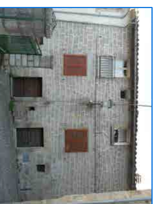
Foto 6 - Prospetto

Rappresentazione modello tridimensionale