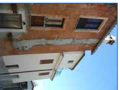
Foto 1 - Prospetto