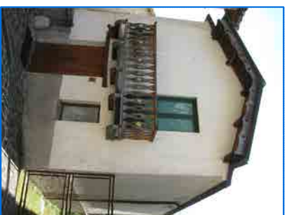
Foto 2 - Prospetto