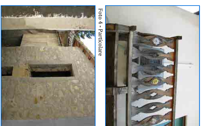
Foto 4 - Particolare