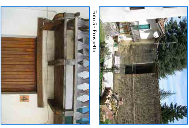
Foto 5 - Prospetto