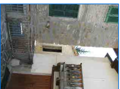
Foto 3 - Prospetto