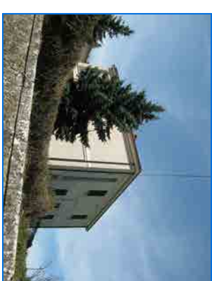
Foto 2 - Prospetto