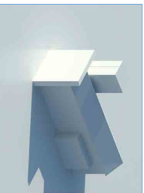
SCHEMA VOLUMETRICO Rappresentazione modello tridimensionale