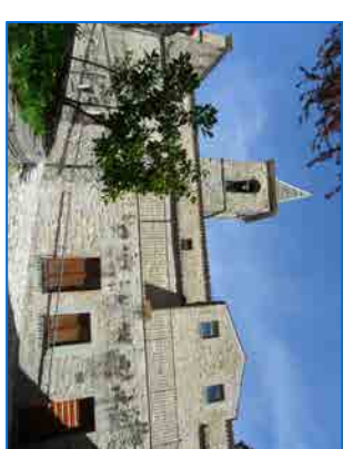
Foto 5 - Prospetto