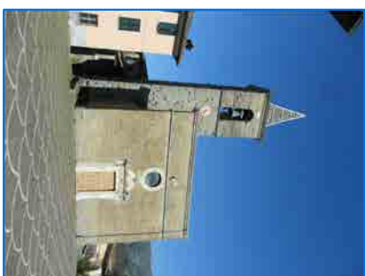
Foto 1 - Prospetto