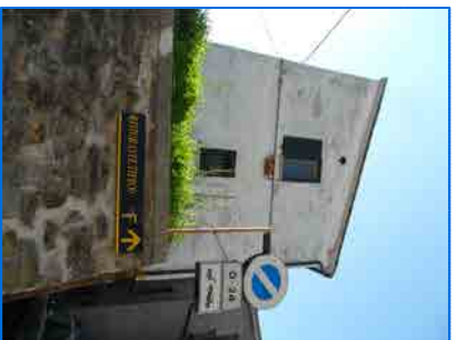
Foto 2 - Prospetto