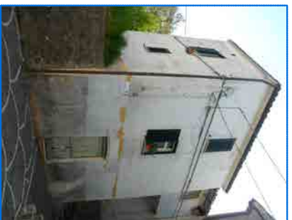
Foto 1 - Prospetto